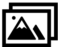
Imagen y Producción